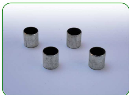
Tulejki no. 43