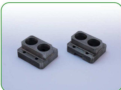
Kości no. 41