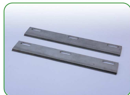
Grzebienie 270 0,8 no. 45