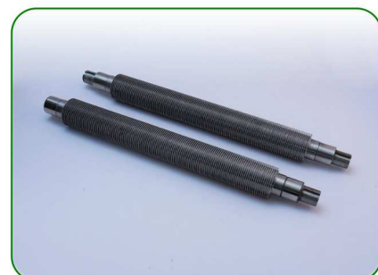
Wałki 270 1,1 no. 48