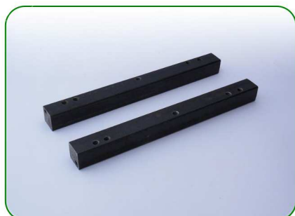
Podpory no. 40