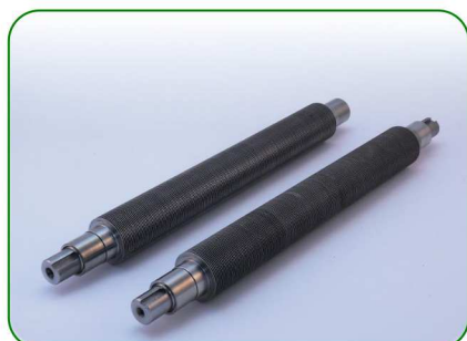
Wałki 270 0,8 no. 46