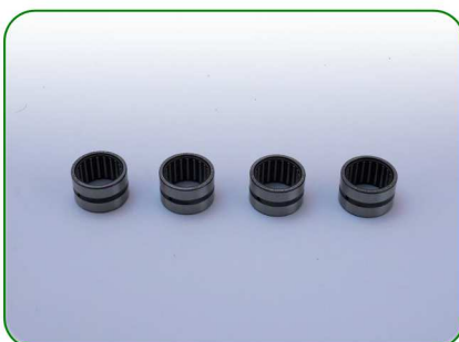
Łożyska no. 44