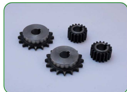
Koła zębate no. 42