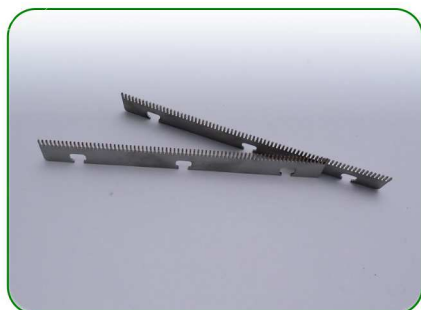
Grzebień 160 1,1 no. 19

Zastosowanie: TREZO 160 1,1; TREZO 160 0,8 V3; TREZO 160 1,1 V2; TREZO 160 1,1 V2 na nóżkach TREZO 160 1,1 V2 HV