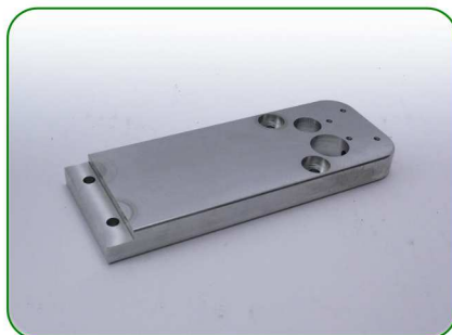
Bok od strony korby (łoż.) no.23

Zastosowanie: TREZO 160 0,8 V3; TREZO 160 1,1 V2 TREZO 160 0,8 V2 na nóżkach TREZO 160 0,8 V2 HV oraz 1,1 V2 HV