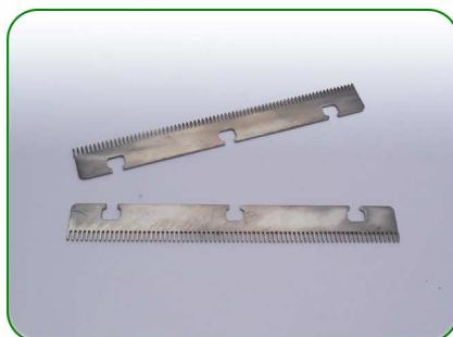
Grzebień gruby 160 1,1 no. 20

Zastosowanie: TREZO 160 1,1; TREZO 160 0,8 V3; TREZO 160 1,1 V2; TREZO 160 1,1 V2 na nóżkach TREZO 160 1,1 V2 HV