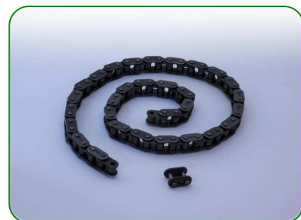
łańcuch no. 27

Zastosowanie: TREZO 160 1,1, TREZO 160 0,8 V3 TREZO 160 1,1 V2 / na nóżkach TREZO 160 1,1 V2 HV