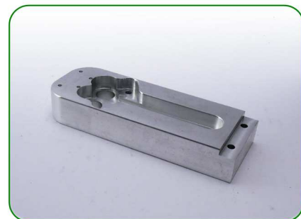
Bok gruby (łożyska) no. 24

Zastosowanie: TREZO 160 0,8 V3; TREZO 160 1,1 V2 TREZO 160 0,8 V2 na nóżkach TREZO 160 0,8 V2 HV oraz 1,1 V2 HV