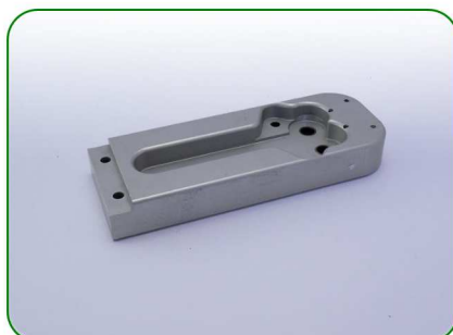
Bok gruby (tuleje) no. 11