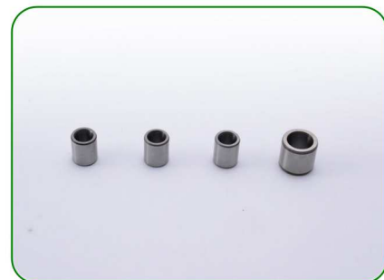
Pierścienie no. 15

Zastosowanie: TREZO 160 0,8 V3 TREZO 160 1,1 V2 / na nóżkach TREZO 160 0,8 V2 HV / 1,1 V2 HV