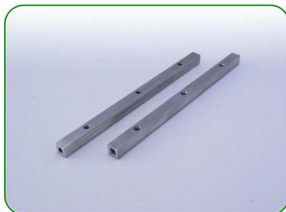
Podpory do grzebieni no. 14

Zastosowanie: TREZO 160 0,8 TREZO 160 1,1; TREZO 160 0,8 V3 TREZO 160 1,1 V2; TREZO 160 0,8 V2 HV TREZO 160 1,1 V2 HV