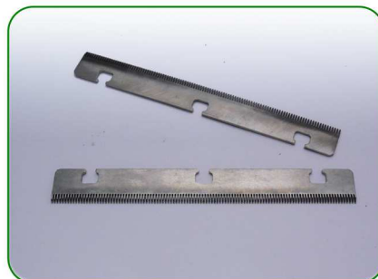
Grzebienie 160 0,8 no. 17