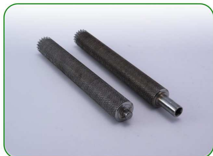
Wałki 160 0,8 (tuleje) no. 16

Zastosowanie: TREZO 160 0,8 V3 TREZO 160 1,1 V2 / na nóżkach TREZO 160 0,8 V2 HV / 1,1 V2 HV