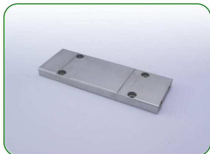
Podstawa no. 13

Zastosowanie: TREZO 160 0,8 TREZO 160 1,1; TREZO 160 0,8 V3 TREZO 160 1,1 V2; TREZO 160 0,8 V2 HV TREZO 160 1,1 V2 HV