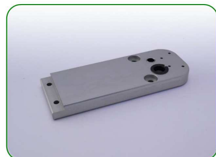
Bok od strony korby (tul.) no. 12