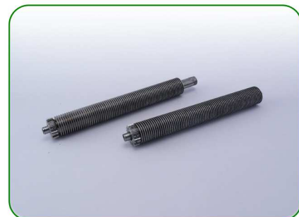
Wałki 160 1,1 (tuleje) no. 18