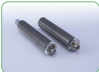
Wałki 100 0,8 no. 7