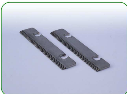
Grzebienie 100 0,8 no. 8