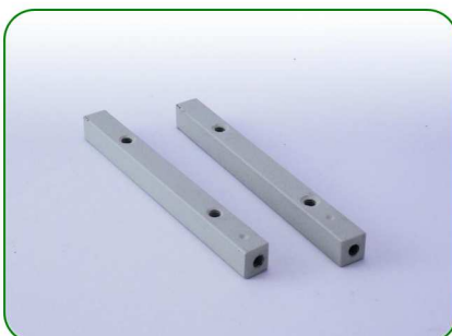
Podpory do grzebieni no. 5