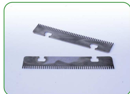
Grzebienie 100 1,1 no. 10