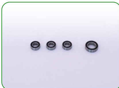
Łożyska no. 53