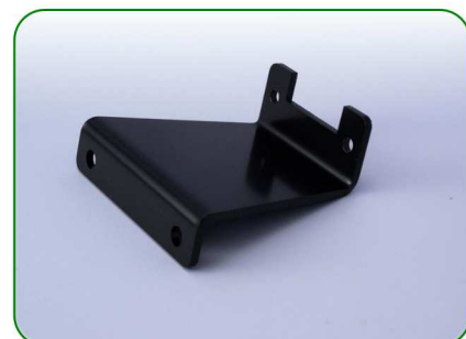
Nóżka czarna no. 6

TREZO 100 0,8; TREZO 100 1,1 TREZO 1,1 HV