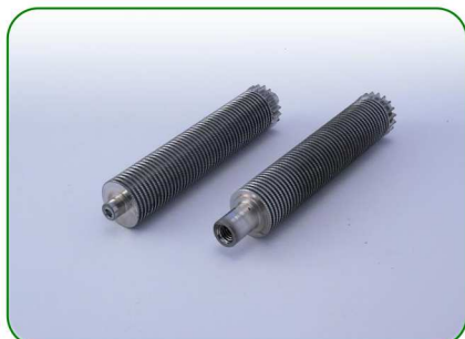
Wałki 100 1,1 no. 9